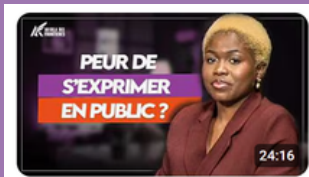
Les secrets de la prise de parole en public