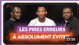
Les erreurs à éviter pour trouver un emploi en France