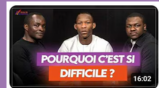
Pourquoi est-ce difficile de trouver du travail en sortie d'école ?

Chaque semaine, ADDF publie des vidéos sur sa chaîne YouTube : http://www.youtube.com/@Audeladesfrontieres .